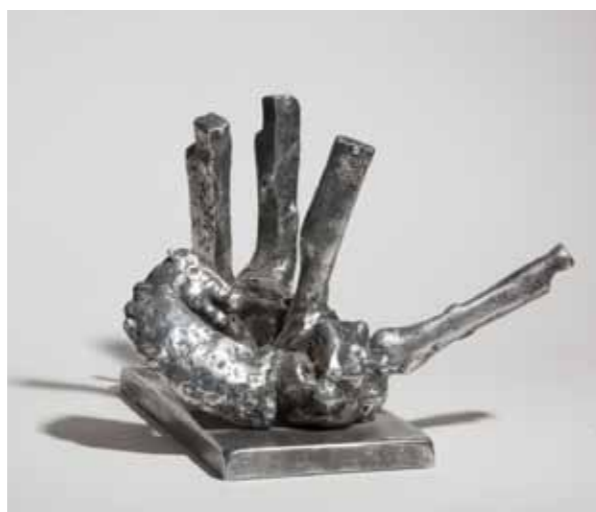
Petar Ujević, Konj sv. Pavla, aluminij