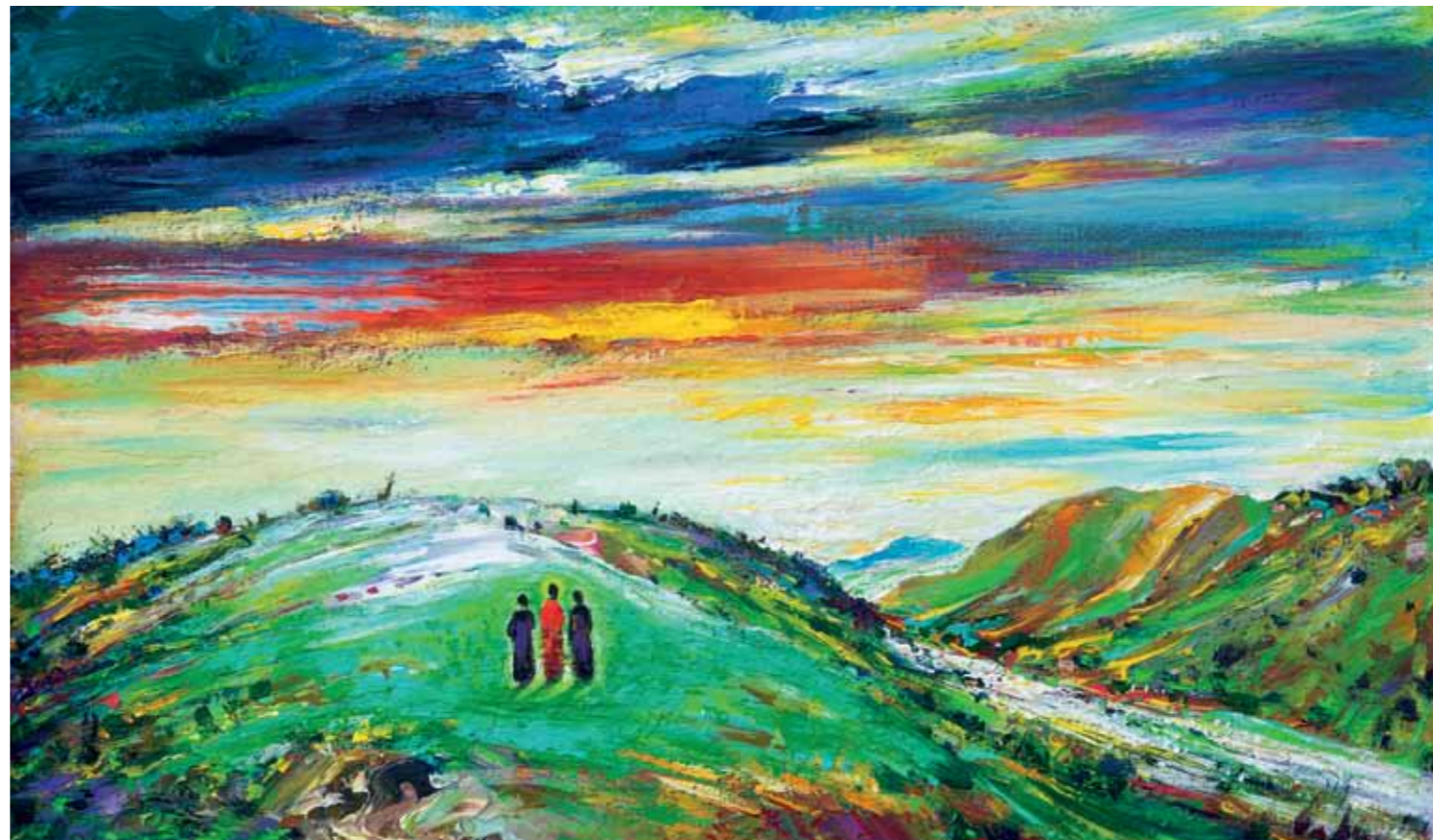
Vladimir Meglič, Na putu za Emaus, ulje na platnu