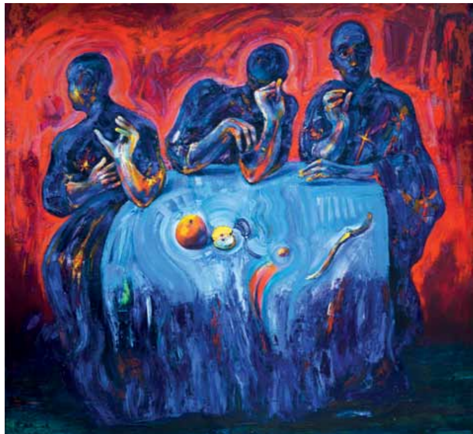
Vladimir Meglič, Abrahamov posjetitelj, ulje na platnu

Ova izložba rezultat je njihovog umjetničkog angažmana u Belišću, s djelima reprezentativnih formata za javne, prvenstveno crkvene prostore. A izložba, pa i u fragmentarnoj formi o pojedinom opusu, s ostvarenjima uglavnom komornih dimenzija, upotpunjuje saznanja o umjetnicima osebujnih poetika.